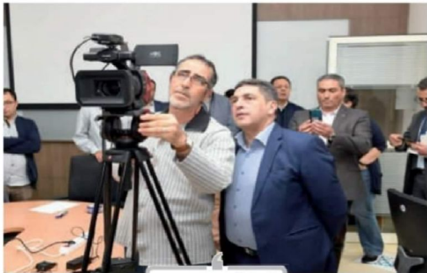
أكد سعيد أمرازي وزير التربية الوطنية والتكوين المهني والتعليم العالي والبحث العلمي، استكمال تقديم الدروس عن بعد إلى غاية نهاية الموسم الدراسي، وأن جميع الامتحانات ستكون في وقتها ابتداء من بداية شهر يونيو، مستعداً لإعلان عن سنة بيضاء، مهما كانت الظروف

علاص روم، الذي أطلقت شركة غوغل والذي يتخـصص في المجال التقني، مع الأخـصـار، أنه يعتدّد تلقية البث المباشر عبر وسائل التواصل الاجتماعي بالإضافة إلى المحاضرات المسجلة والمواعيل الإلكترونية للكتابة، كما يتواصل مع الطلبة الباحثين حول العروض والبحوث الجامعية من خلال تطبيقات التراسل الفوري.